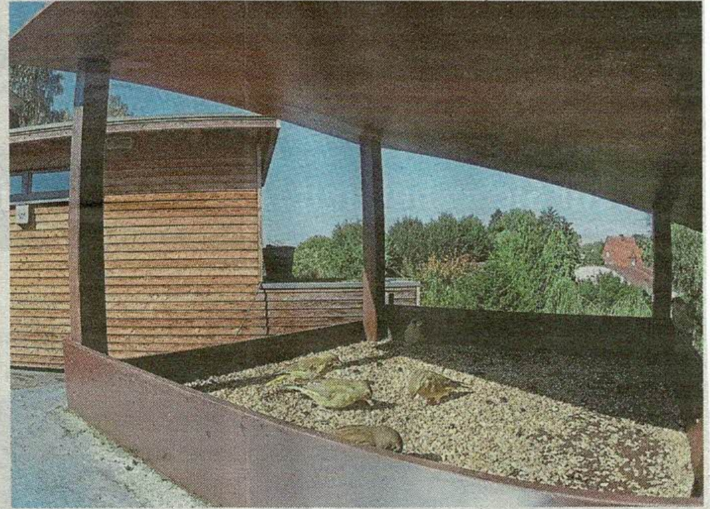
Sicher, sauber, gut gefüllt: Am Artenschutzhaus nehmen die Vögel das Nahrungsangebot gerne an.

Wichtig ist die Wasserstelle nicht nur in trockenen