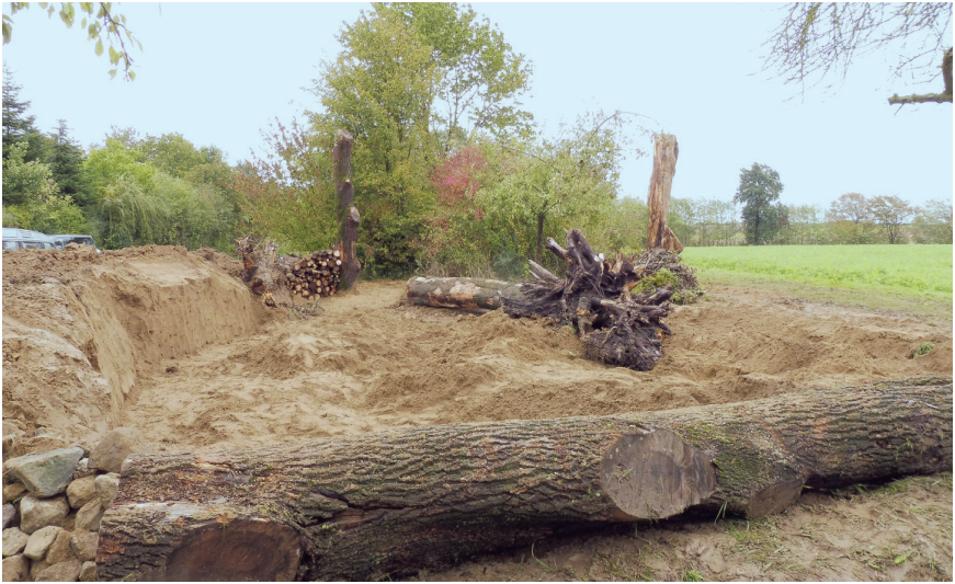
Abb. 6: Die Rezeptur für die Wildbienen-Nistfläche in Wellingholzhausen besitzt einen Modellcharakter im Osnabrücker Land: Steilwand, Astholzhaufen, stehendes Totholz starker Dimension, Sandfläche unterschiedlicher Mächtigkeit, liegendes Totholz und mächtige Wurzelteller.