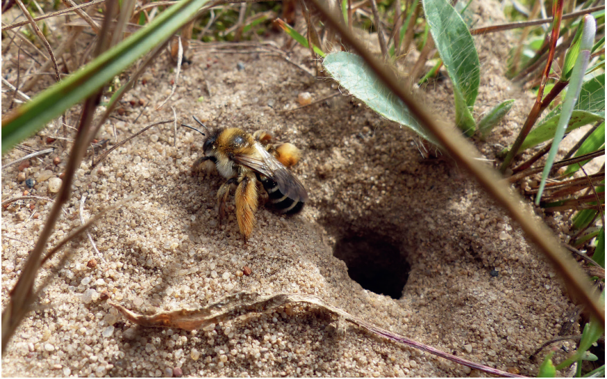
Abb. 9: Eine Kandidatin für die Wildbienen-Nistfläche: die Dunkelfransige Hosenbiene. Sie nistet in selbstgegrabenen bis zu 60 cm tiefen Hohlräume im Sand bzw. in lockerer Erde.