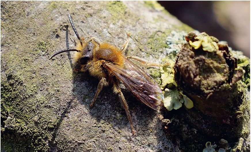
Abb. 10: Die Weißflaum-Sandbiene nistet bereits in Wellingholzhausener Gärten und dürfte auch bald das neu gestaltete Areal besiedeln. Sie bevorzugt lichte Waldränder, Feldhecken, Magerrasen und Gärten mit vegetationsarmen Stellen.