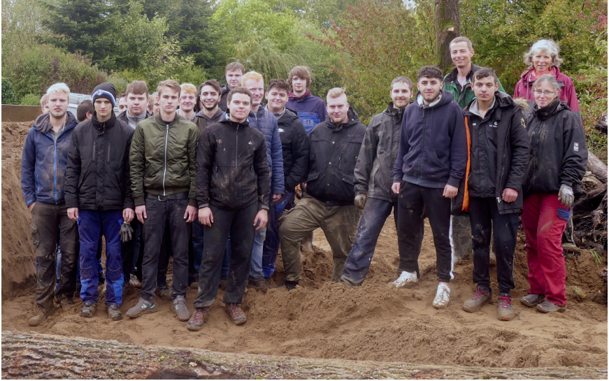
Abb. 11: Die Umsetzung des Vorhabens „Manche Bienen mögen’s steil“ war eine Herausforderung, die nur dank tatkräftiger Unterstützung vieler Akteure realisiert werden konnte. Auch über 20 Auszubildende der Wilhelm Niemann GmbH & Co. aus Neuenkirchen packten mit an.

und Landschaftsbau Bredenstein half uneigennützlich mit Materialien wie Baumstämmen und Maschinenpower. Die Sand Boden Recycling GmbH stellte unentgeltlich Sand und Löss zur Verfügung. Die erforderlichen Flächen bringt die Stadt Melle in das Vorhaben ein. Sie sorgte auch für die Neuanlage des Blühstreifens.