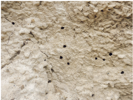
Abb. 8: Ein kleiner Erfolg: Im ersten Jahr nach der Fertigstellung der Steilwand am Ortsrand von Wellingholzhausen zogen die ersten Wildbienen ein. Solche Nistplätze werden von den Bienen sehr sorgfältig ausgewählt, da die Weibchen fast ihre gesamte Lebenszeit als Vollinsekt mit dem Nestbau verbringen und der Nistplatz sich auch über Monate für den Nachwuchs bewähren soll.

Ergänzend wurden in Randlagen der für erdnistende Bienen