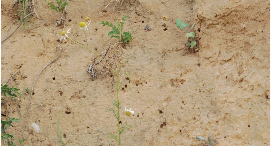
Abb. 3: Einige Wildbienen-Arten graben Erdnester in Steilwände, wie hier in Döhren. Kleine Löcher mit einem Durchmesser von wenigen Millimetern verraten ihre Anwesenheit.

send Blüten für eine einzige Brutzelle. Der Fortpflanzungserfolg ist demzufolge nicht nur abhängig vom Vorhandensein der bevorzugten Pflanzenart/en, sondern ganz entscheidend auch von deren Verfügbarkeit in ausreichender Anzahl. Dabei spielt weiterhin eine Verfügbarkeit der Nahrung in einer geringen Entfernung zum Nest eine wichtige Rolle, um ausreichend Nachwuchs zu generieren und so den Bienenbestand stabil zu halten. Beispielsweise ist bekannt, dass bereits bei einer Flugdistanz von 150 Metern zwischen Nistplatz und Nahrungspflanzen rund 25 % weniger Brutzellen pro Saison angelegt werden können, als wenn Nistplatz und Pollen- bzw. Nektarquellen unmittelbar nebeneinander liegen. 2 Lange Flugdistanzen haben daher eine negative Auswirkung auf den Fortpflanzungserfolg. Deshalb ist die reine Anlage von Blühflächen, ohne dass Nisthabitate in der Nähe verfügbar sind, nur ein Baustein eines erfolgreichen Wildbienen-Schutzes.