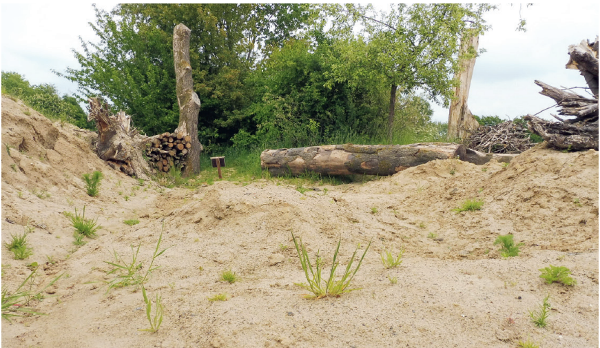
Abb. 7: Auslaufende Neigungen am Fuß der Steilwand (linker Bildrand) und schütter bewachsene Sandflächen sind für einige erdnistende Wildbienen-Arten von großer Bedeutung.