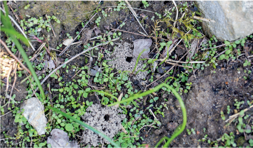
Abb. 2: Die Mehrzahl der hiesigen Wildbienen-Arten legt ihr Nest im Boden an. Ein kleines Loch mit feinkrümlicher Erde am Rand weist auf ein frisch angelegtes Nest hin. Der Gang in den Boden, der zur Brutzelle führt, ist je nach Art unterschiedlich tief (von wenigen Zentimetern bis über einen halben Meter) und kann verzweigt sein.