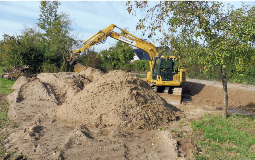
Abb. 4: Der Einsatz von Bagger und weiteren Großgeräten war erforderlich, um das rund 200 Quadratmeter große Areal am Ortsrand von Wellingholzhausen als Nistfläche für Wildbienen herzurichten.