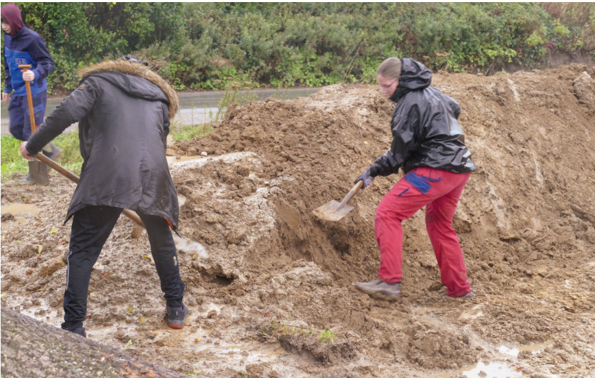
Abb. 5: Viele fleißige Hände sorgten für den erforderlichen „Feinschliff“ der Wildbienen-Nistfläche.