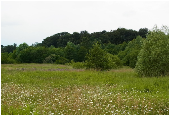
Die Dynamik-Insel „Dallmann“.

Dieser Lebensraum ist geprägt von einer reichen Staudenflora. Der Feldthymian hat hier ebenso ein Auskommen wie der Frauenmantel. Hier zeigt uns die Natur einmal mehr, wie mannigfaltig sie sich entwickeln kann, wenn man sie nur lässt. Auf der Dynamik-Insel „Dallmann“ wurde nämlich weder gesät noch gepflanzt. Alles, was hier wächst, hat die Natur alleine hervorgebracht.